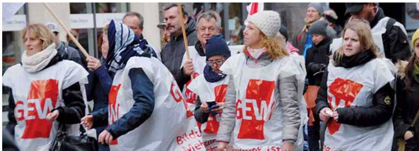
Kommunale Lehrkräfte beim Warnstreik 2016 in München

Die Verhandlungen beginnen am 26. Februar. An dem Treffen nehmen der Bundesinnenminister, die Spitze der Vereinigung der kommunalen Arbeitgeberverbände (VKA) sowie auf Arbeitnehmerseite die Verhandlungsführer von ver.di, GEW, GdP, IG BAU und dbb teil. Weitere Verhandlungsrunden sind für den 12./13. März und den 15./16. April geplant.